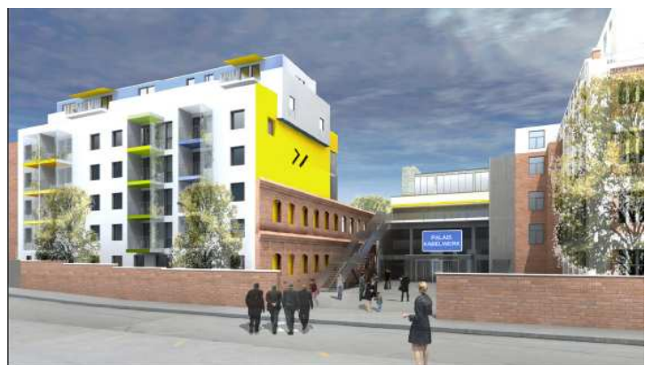
Ansicht Oswaldgasse Frauenwohnprojekt BP Y und Kultur

Unmittelbar nördlich des Bauteiles X wird das „Palais Kabelwerk“ ein Kulturbau mit 2 großen Veranstaltungssälen, errichtet. Dieses Kulturzentrum wird direkt von der Oswaldgasse über einen „Kulturhof“ erschlossen. Nördlich daran wird das Frauenwohnhaus „KaYpso“ errichtet. Die Wohnungen sollen vorwiegend von Mietgliedern des Frauenvereins „ro*sa KaYpso“ „gemietet werden.